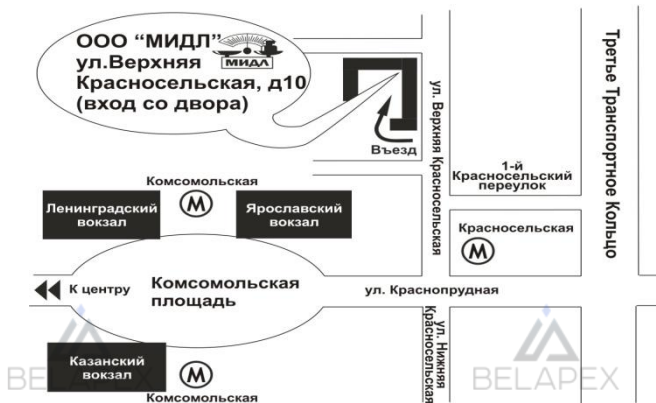
Схема проезда к офису фирмы “МИДЛ”

Филиал ООО «МИДЛ» тел/факс (499) 264-57-65, 264-57-43